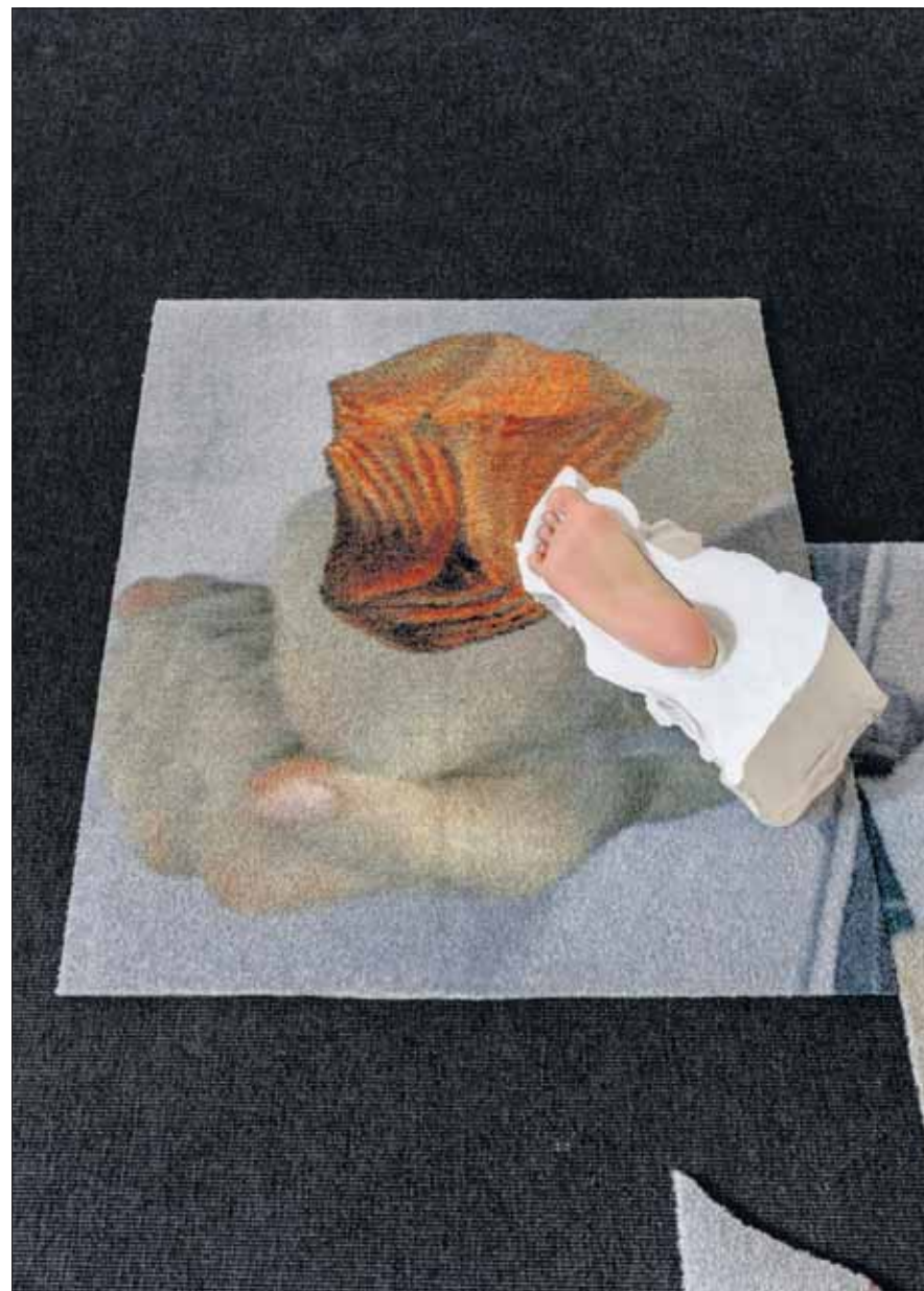
TILBAKE IGJEN: Gamle kjenninger fra tidligere utstillinger dukker opp i nye sammenhenger, som en vokstavstøpning av en fot.

Galleriets hovedrom er altså mørklagt, og i midten lyser en stor skjerm med flimrende bildecollager og et lydspor hvor rytmen dirigerer bildene. «Blant» er en såkalt desperasjonsanimasjonsvideo , en betegnelse Haaland bruker på sine videoarbeider, og som sikter mot å fange en desperat tidsånd, politisk og eksistensielt. Det hintes altså om noe akutt, understreket i gjentakelser, som når blaffende eksplosjoner legges oppå hverandre og hus står i brann.