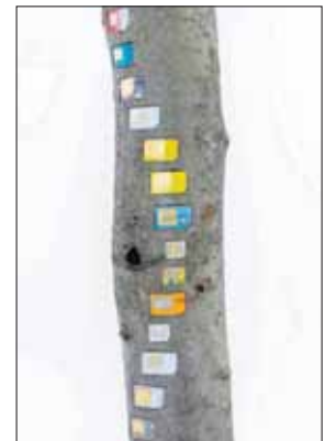
DIGITAL HUKOMMELSE: Sim-kort og seljestokk.

De henslengte stubbene og røttene er der bare, som malplassert rekved, men de er bearbeidet og alle gitt tittelen «på»; samtlige verk i utstillingen er faktisk titulert ved preposisjoner: ved, i, hos. Dette antyder den språklige bevisstheten bak arbeidene, satt inn i et meningsskapende, men også vilkårlig, system. Det tilforlatelige ved disse små ordene som forklarer hvordan noe er plassert i forhold til noe