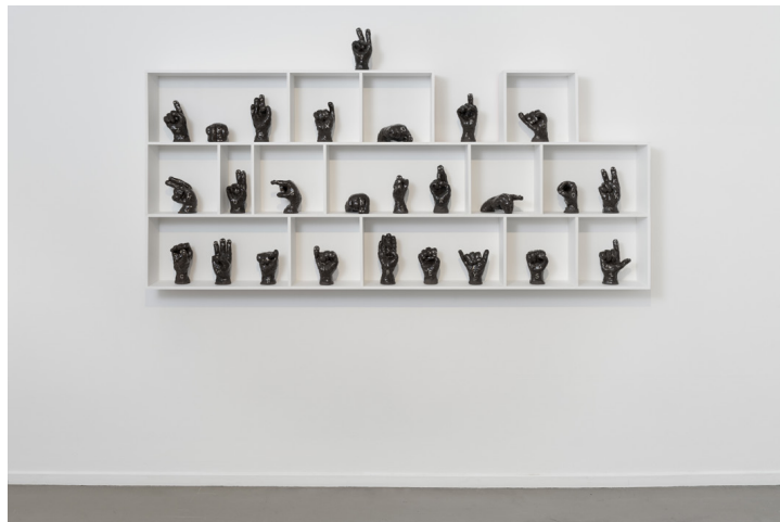
SARA KORSHØJ CHRISTENSEN: A-ZS - UNVOICED ANSWERS, RESOLUTIONS AND POTENTIAL DISASTERS, 2019.