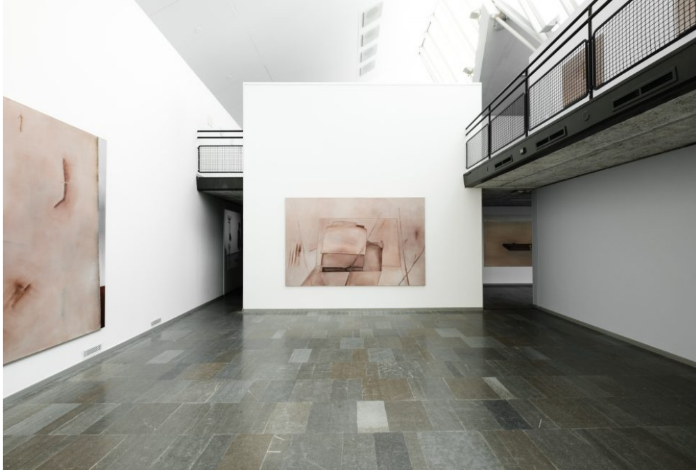
Installationsvy med Risk (bryta ned) , 2019.