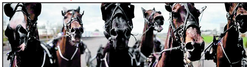
UTSOLGT: Dette hestebildet til 100 000 kroner pr. foto har McAlinden solgt seks stykker av.