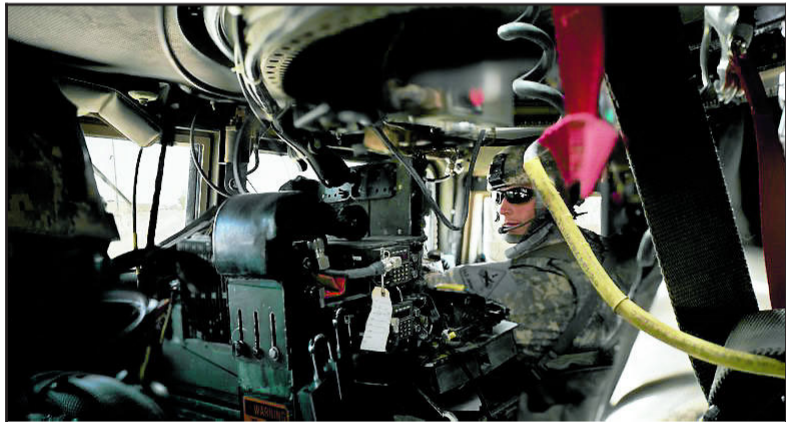
I IRAK: Amerikansk soldat i Sør-Irak.