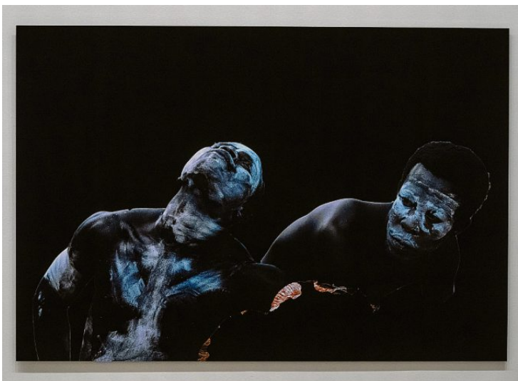
Det er i Ghana hun primært henter inspirasjon og motiver til verkene sine, selv om også noe springer ut av de trønderske omgivelsene hun befinner seg i.