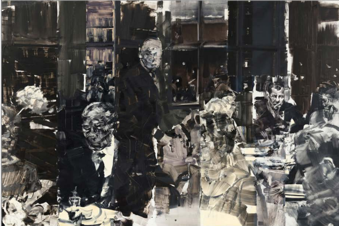
↑ «Stockholm 1.2» (2022) i svart-hvitt passer dårlig inn i med resten av de fargesterke maleriene i utstillingen, mener Subjekts anmelder.