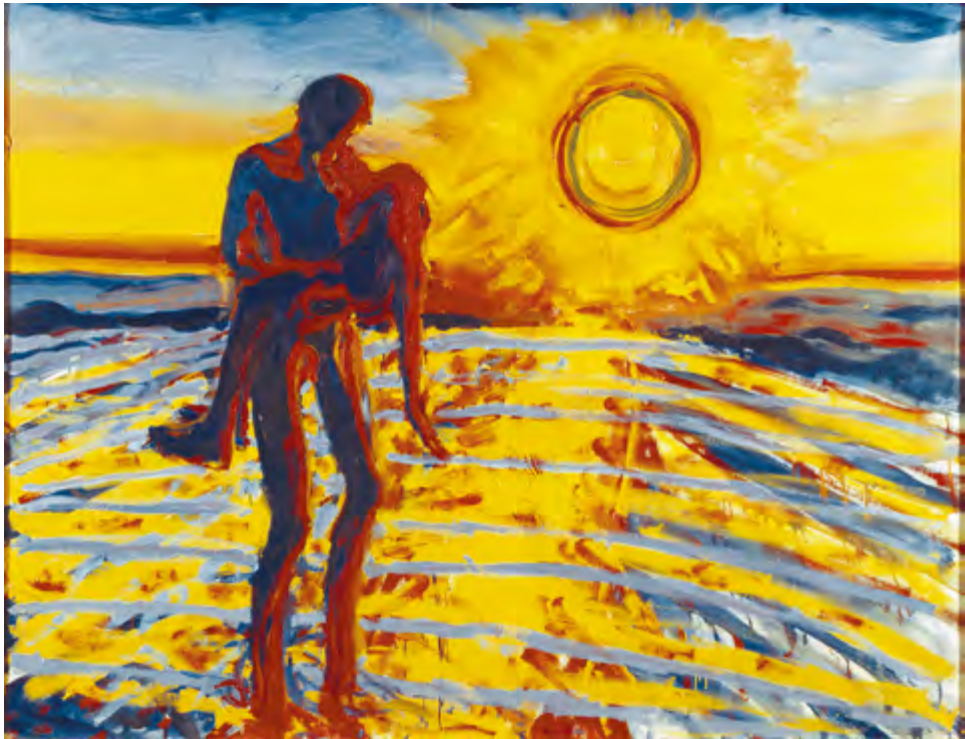
Frans Widerberg, Ut av vannet , 1976, olje på lerret, 114 x 150 cm