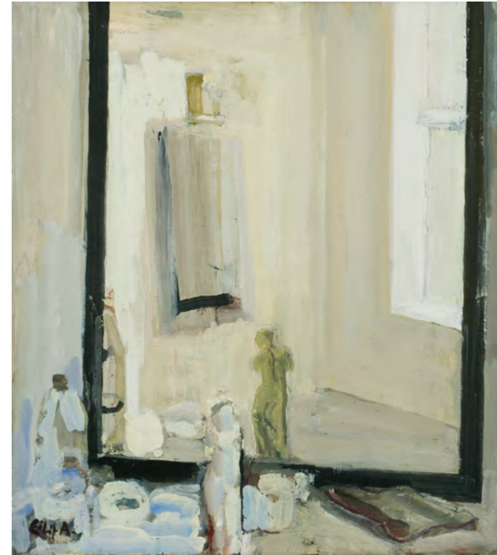
Eilif Amundsen, Atelier speil , 1985, olje på lerret, 78 x 70 cm