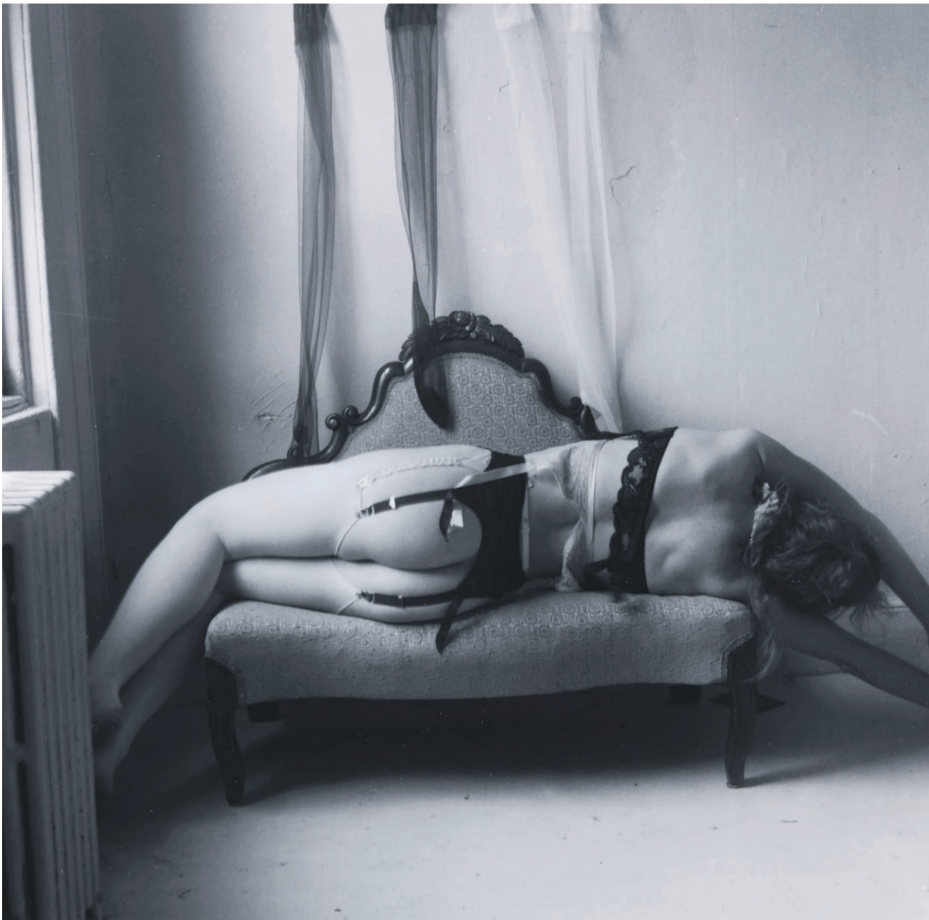
MOTEFOTO: Blant Woodmans inspirasjonskilder var mange motefotografer. «Untitled, New York» er ett eksempel, tatt i 1979-80.