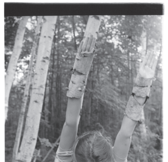
TREMENNESKET: I «Untitled, MacDowell Colony, Peterborough, New Hampshire» (1980) imiterer Woodman trærne i skogen. Bildet er et eksempel på at hennes bilder også har en humoristisk side.