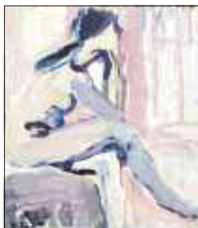
SPENNINGSFYLT OG LEVENDE: «Sittende modell», 1986,