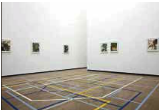
PARODI: «Flatness», Jan Freuchen