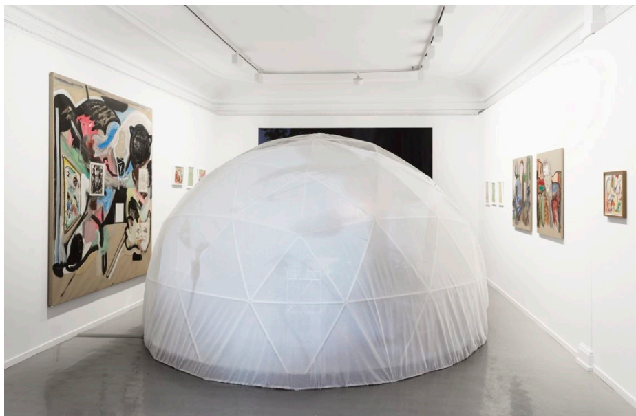
Bakketun & Norum, Anthropology Archaeology Apology , 2018.

Oslo Kunstforening, Oslo 18. januar - 25. februar 2018