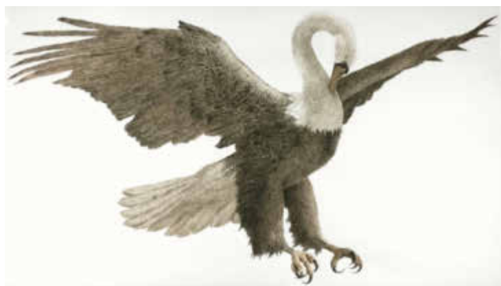
Christian Messel, uten tittel, farget blekk på papir.