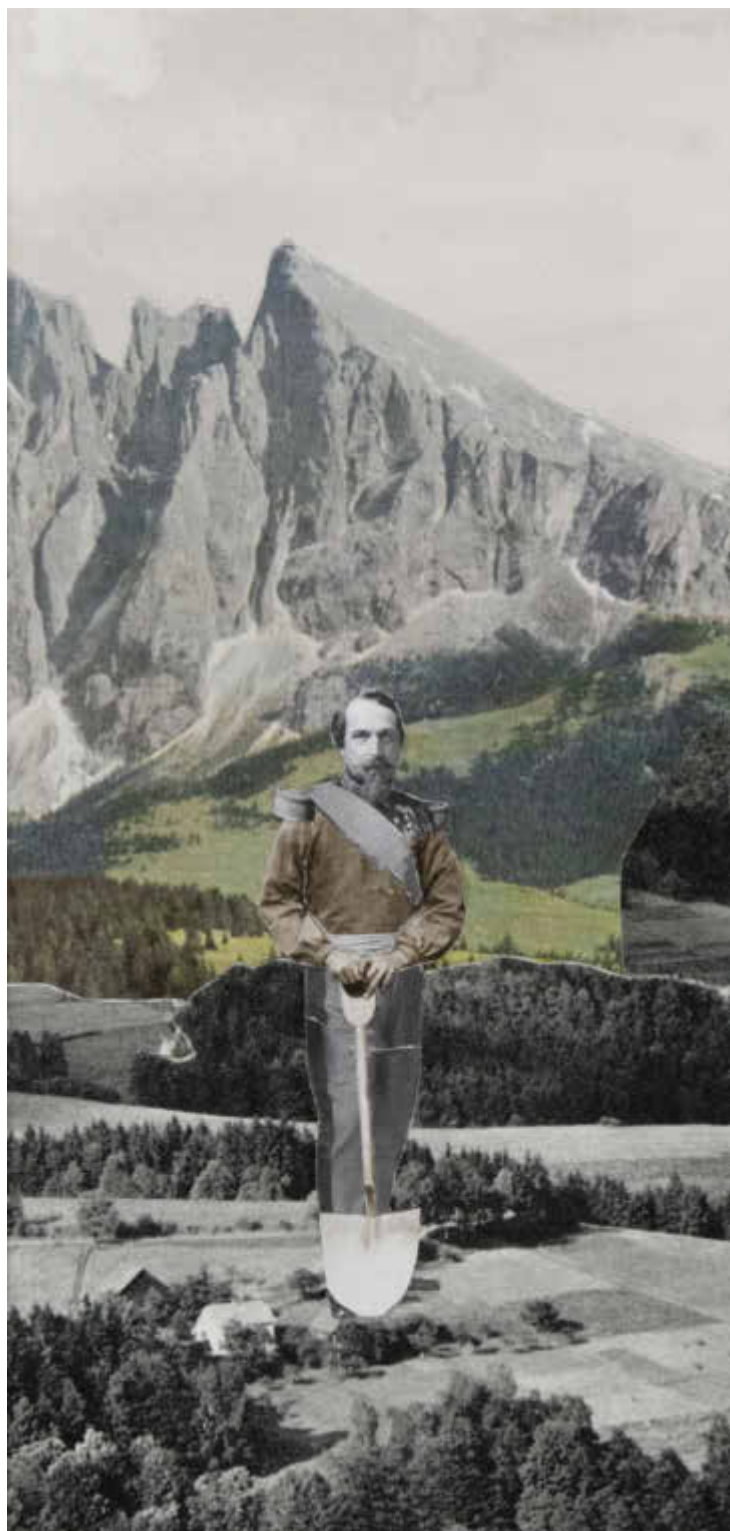
Christian Messel, «Alle skal i jorden 2», collage.

Messel balanserer den tunge tematikken med innslag av det absurde, det vakre og en fin dose mørk humor, noe som bidrar til at utstillingen aldri oppleves anmassende eller repetitiv. I tillegg klarer kunstneren på finurlig vis å overføre en form for subliminale meldinger; altså ideer som legger seg i et underbevisst plan og åpner for nye tanker og filosofier omkring rigide og tilsynelatende låste maktstrukturer. Tanker som varer lenge etter at besøket er over.