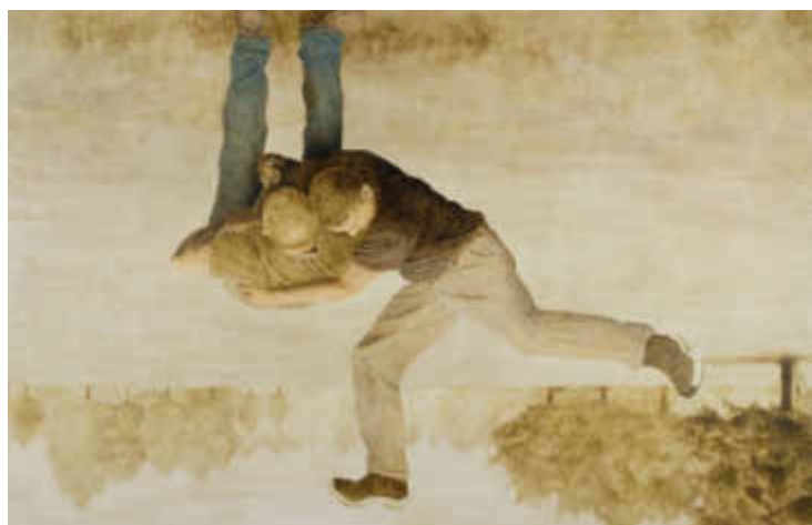
Christian Messel, uten tittel, eggtempera.

Kjente malerier, skulpturer og monumenter, nå avbildet på postkort, i magasiner eller bøker blir (tidvis bokstavelig talt) revet i biter, for så å settes sammen igjen med fornyet innhold.