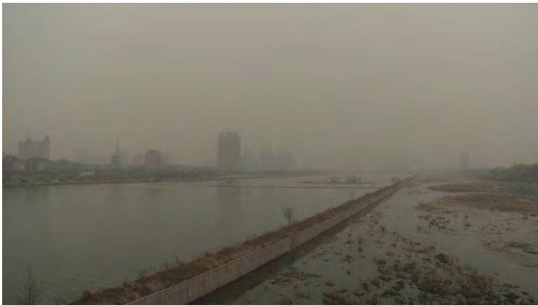
Bodil Furu, Misty Clouds III , 2010, HD video, 52 min.

Kontrastene mellom intervjuene og de mer poetiske bildene i videoen ikke uvanlige virkemidler innenfor film eller dokumentar, men i Misty Clouds skjer det noe usedvanlig. Furu tegner et samfunn som er avhengig av kull, hvor mange av samtalene kretser rundt kullelets viktighet i det kinesiske samfunnet, som minner om bilder og historier fra den industrielle revolusjonen, samtidig som globalisering sørger for at verdier og konsepter som økologisk gårdsbruk entrer dialogen og påvirker en generasjon av studenter som behersker engelsk. En kollisjon over århundrene sett fra den vestlige verdenen, men normal hverdag i Taiyuan.