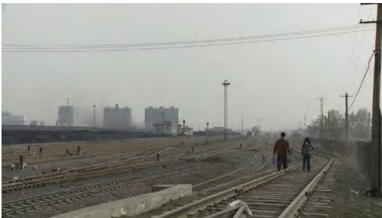
Bodil Furu, Misty Clouds II , 2010, HD video, 52 min.

Misty Clouds vises som en stor projeksjon i det indre rommet av galleriet, som kanskje skal minne litt om en kinosal. En strammere presentasjon av videoen i visningsrommet hadde verket virkelig fortjent. Utstillingen inneholder også et annet verk av Furu, OPERA (2008), som vises på en flatskjerm i det første rommet og blir en faksmileversjon av filmen som er en del av det offentlige kunstprosjektet for Den Norske Opera og Ballet. Det gamle operabygget som lå midt i Norges politiske smørøye på Youngstorget utforskes og igjen bruker Furu en blanding av det dokumentariske og poetiske, men her er Furus inngrep tydeligere, hvor politiske formuleringer rundt den dramatiske kunsten flimrer over displayet. Furus balansegang er virkningsfull, men krever også et visningsrom som tar materialet og formatet på alvor.