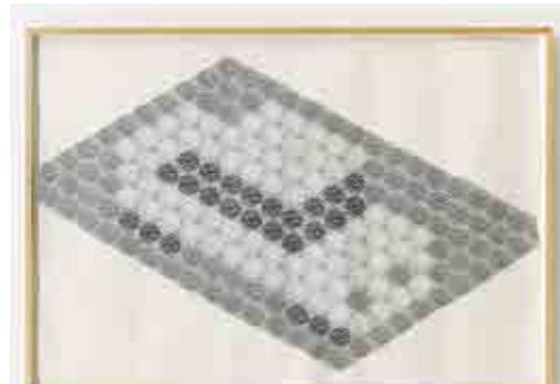
'Entwurf für U-Bahn (Auto) Design for Subway (Car)', 1990, photocopy collage on paper, 169 x 296 cm, unique. Courtesy the artist and dépendance, Brussels. Photo credit © Kristien Daem

In lijn met recente tentoonstellingen over niet gerealiseerde of als mislukt beschouwde kunstwerken, stelt dépendance in Brussel momenteel zeven werken voor van de Duitse kunstenaar Thomas Bayrle, die in 2014 nog een gesmaakte overzichtstentoonstelling had in Wiels. Het gaat om een reeks werken die de kunstenaar in 1990 maakte als ontwerp voor een metrostation in Offenbach, dichtbij Frankfurt am Main. De door hem gekozen motieven – een auto, vliegtuig, trein en voetganger – passen dan wel mooi binnen de context van de openbare opdracht, maar ze werden niet weerhouden.