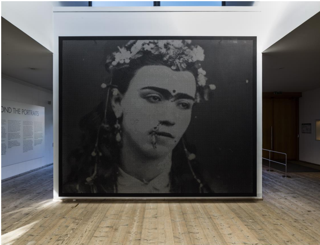
Anne-Karin Furunes, Crystal Image XIII, 2014. Akrylmaling på perforert lerret.