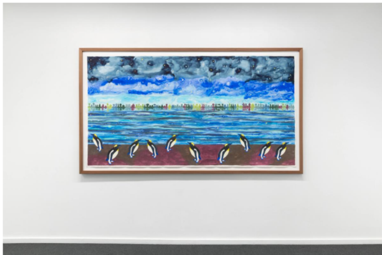
Pingviner er blitt et av Mathiasens gjentagende motiver. I utstillingen Folly refererte det til blant annet et eksperiment på Dikemark psykiatriske sykehus på 30-tallet, hvor pingviner ble hentet inn til hagen som rekreasjon for pasientene – pingvinene døde nesten med én gang.

En dame i gyldengul kjole åpner en blå dør. Den påfølgende serien går gjennom en syklus som henter inn det blå og det gule: Fra en gylden soloppgang, til en blokk som våkner til live om morgenen, via høylys dag, til solnedgang og et ensomt rådyr, plassert slik at det er rettet mot det siste bildet hvor en skogbrann lyser opp himmelen. Apokalyptiske greier.