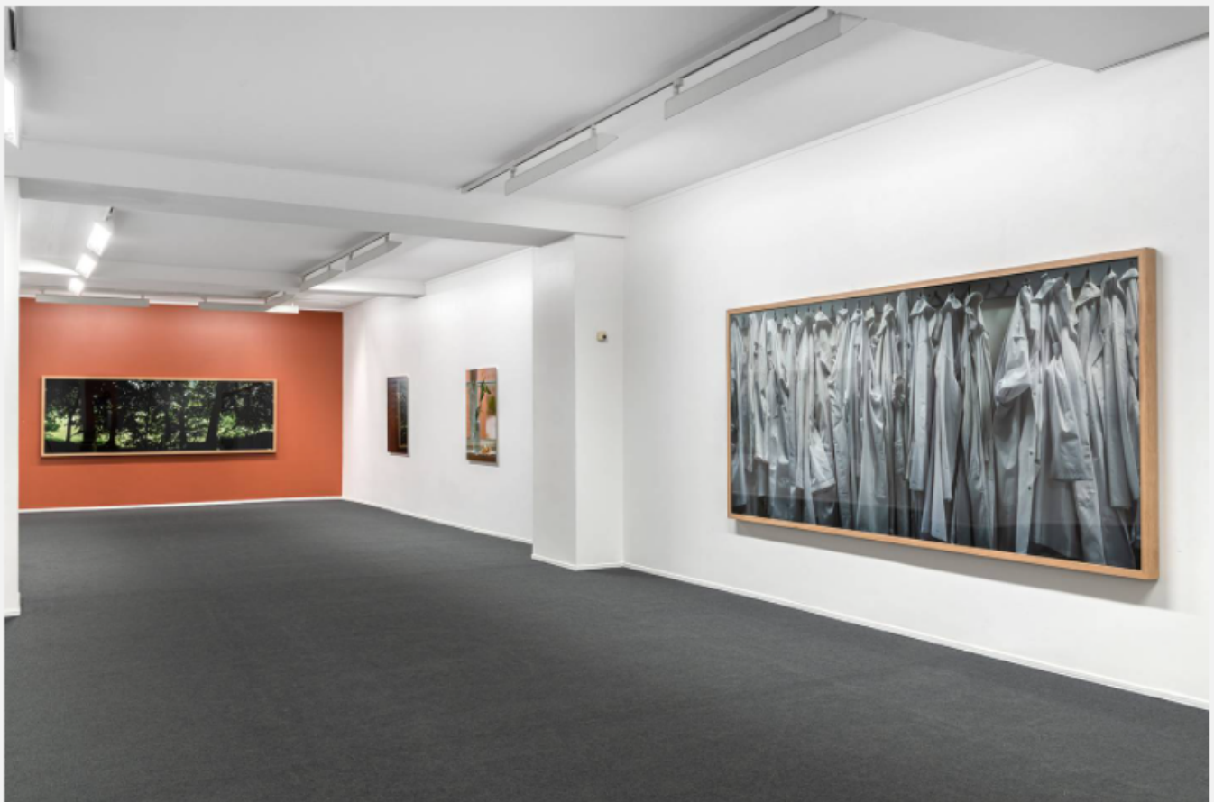
Bildet av laboratoriefrakkene, «White Coats» (2017) til høyre. (Mikkel McAlinden)

Manipulering av bilder er blitt dagligdags. Vi bruker og forholder oss til filtre og effekter i ulike bildeprogrammer og på sosiale medier med den største letthet. Vi tror det er morsomt. Men i den andre enden av skalaen gir bildemanipulering grunn til frykt. Ansiktsgjenkjenning brukes aktivt i (politisk) overvåking. Generering av falske fotografier og videoer, såkalte «deepfakes», er verktøy som i sin ytterste konsekvens truer demokratiet og ytringsfriheten. Det er blitt mulig, om ikke enkelt, å lage filmer av politikere eller vanlige mennesker der datateknologien setter sammen bilder og lyd slik at de sier og gjør ting de aldri har sagt eller gjort.