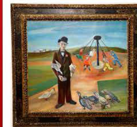
«Karusellen» av Reidar Aulie, malt i 1941 mens det tyske regimet la restriksjoner også på kunstneriske uttrykk. Duene har fått i tyske uniformsfarger.