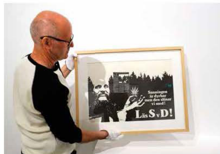
«LSD» av Kjartan Slettemark påskriften er talende i våre dager.