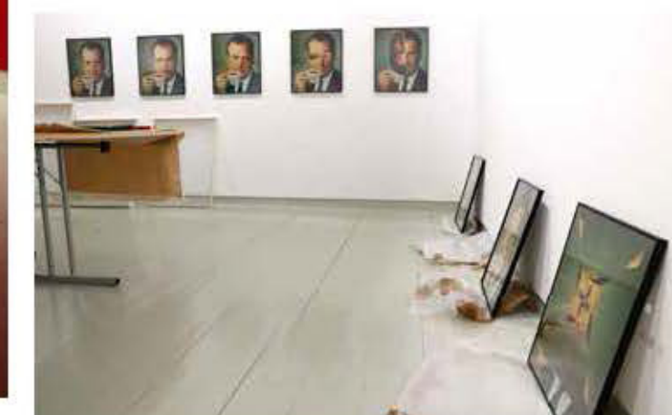
«Nixon visions» (1971) av Kjartan Slettemark, her i ferd med å bli montert på veggen.