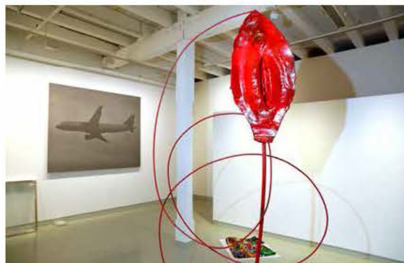
Arnold Haukelands «Kjærlighetsblomst» (1973) og et titteløst foto av Tom Sandberg fra 2001. Kjartan Slettemarks Nixon-jakke (1973) venter på å bli montert.