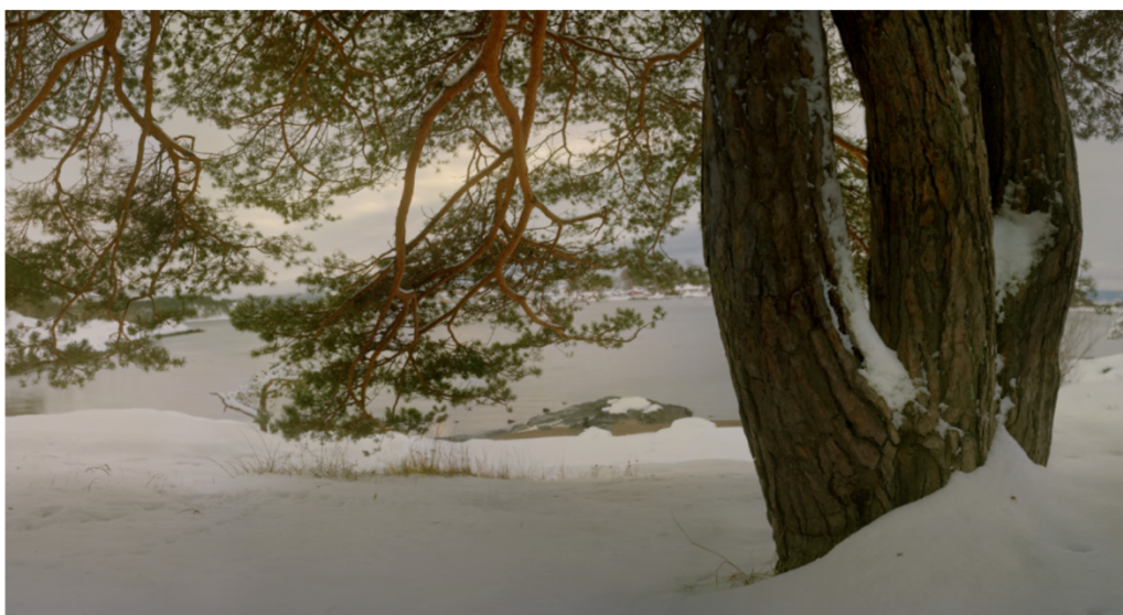
Mikkel McAlinden, Hovedøya , 2021, C-print, 167 x 305 cm.

Hovedøya (2021) ser ut som et vakkert landskapsfotografi tatt på stranden en vinterdag. En tredelt furustamme okkuperer hele høyre side av bildet. I midten lener treets flotte, rødbrune greiner seg ned mot bakken. Vekslingene mellom skarpe og ufokuserte kvister utfolder seg som en spiral som tiltrekker seg blikket mitt, jeg får et tunnelsyn og leter etter de øverste kvistene og den grå himmelen overfor. Men nå ser det brått ut til at disse greinene er fotografert fra et froskeperspektiv. Jeg brekkes liksom bakover, som om bildet tar kontroll over kroppen min og tvinger meg til å se opp. McAlinden snur om på den gamle myten som anklager fotografiet for å stjele sjelen til personen som avbildes. Isteden kjennes det i korte øyeblikk ut som McAlindens absorberende kompositter stjeler kontrollen over meg, fotografiets betrakter, via blikket mitt, og begynner å dirigere meg. Det er en svimlende følelse.