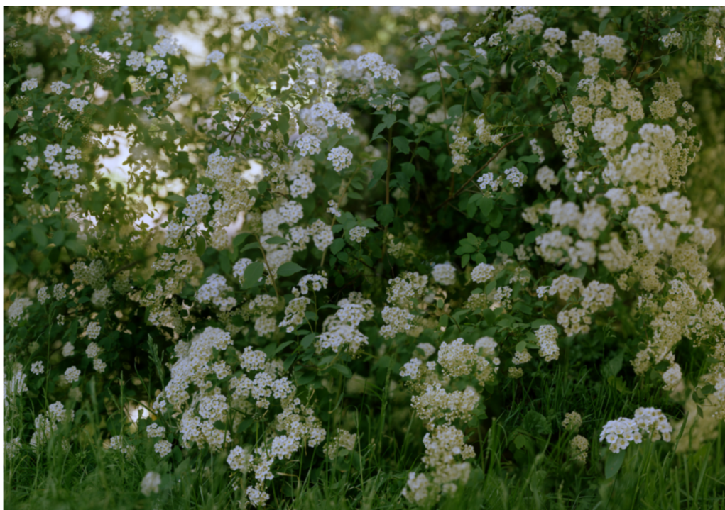
Mikkel McAlinden, Lindern , 2023. C-print, 185 x 262 cm.

Den nye utstillingen består av syv slike bilder, laget de siste tre årene. Alle er i store formater og de fleste måler over 250 cm i bredde. Rosenhof (2023) er tre meter bredt og veldig grønt. Her er blomkarseblader avbildet på kort avstand, slik at bladenes teksturer og hvite nervetråder blir påtakelige. Små vandrdåper balanserer på bladene. I den venstre delen av bildet ses gule blomster, til høyre er blomstene røde. Det kan se ut til at McAlinden har fotografert nesten hvert eneste blad. Selv om de ligger oppå hverandre, sørger det gjennomgående skarpe fokuset for å oppheve forskjellen mellom forgrunn og bakgrunn. Det brede formatet og de mange varierte teksturene gjør betraktningen oppslukende, som et dykk ned i et duggfriskt blomsterbed.