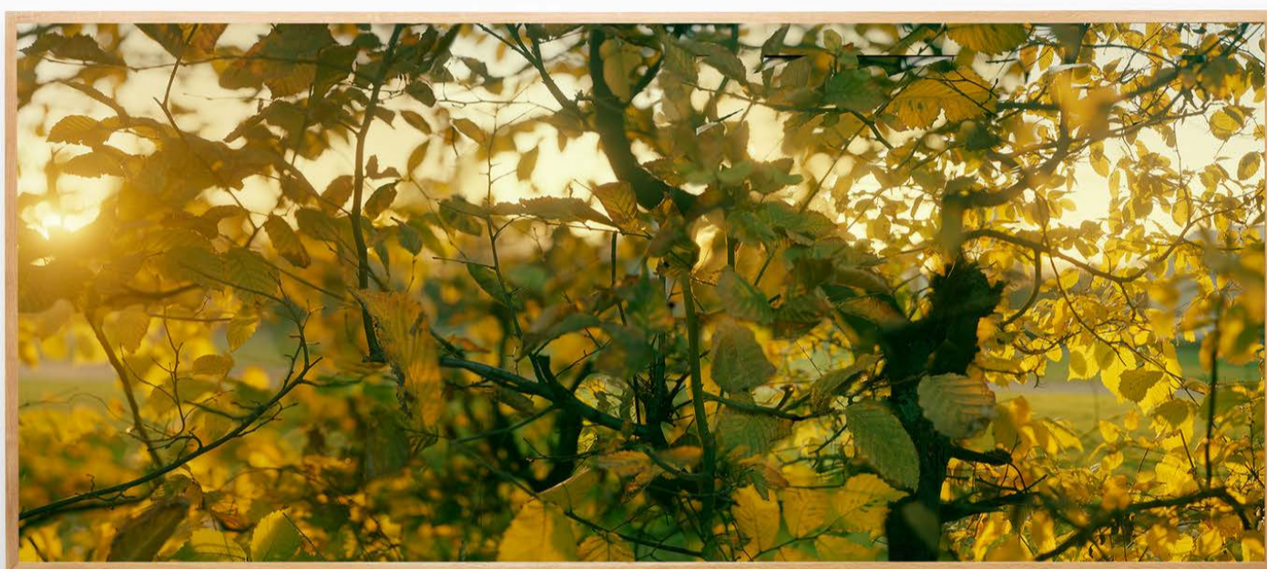
Mikkel McAlinden: Tøyenparken , 2023, C-print © Mikkel McAlinden / BONO 2024

Hele året later til å være presentert i disse bildene, men det grønne skiller seg ut som et grunnmotiv; i verk som Rosenhoff , Lindern og Walk in the Park handler det så å si om å se og oppleve grønnhet som sådan. Grønt som et (natur)fenomen. I Rosenhoff driver det trange billedrommet og blomsterkarsenes altomfattende tilstedeværelse motivet mot oppløsning og non-figurasjon. Uten at McAlinden trer inn i verket gjennom fakter eller signatur, som en abstrakt ekspresjonist ville gjort. Samtidig motarbeider klarheten og skarpheten i bildet den abstraherte kvaliteten. Resultatet blir merkelig taktilt og oversanselig; det er bilder du hører lyden av, bilder du kjenner følelsen av under føttene. Men fremfor alt er de gjennomførte som formale gjenstander.