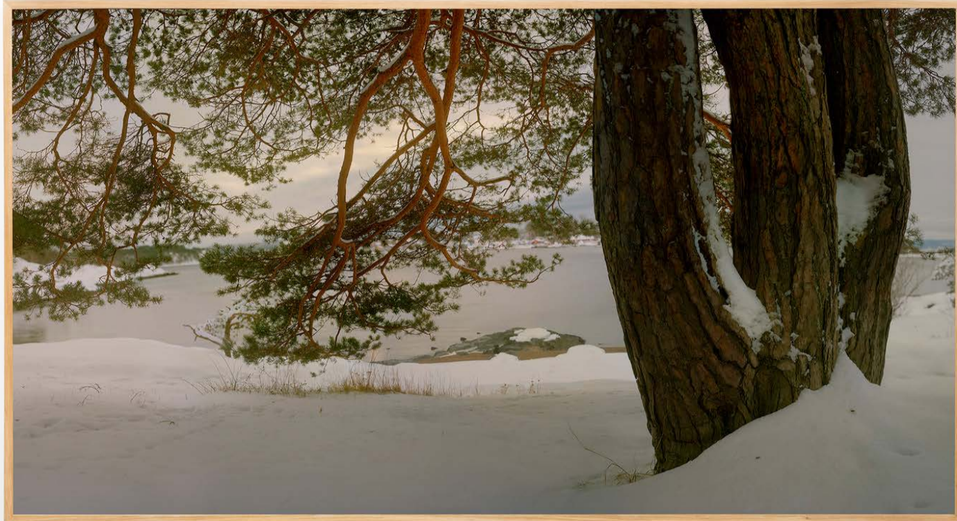
Mikkel McAlinden: Hovedøya , 2023, C-print © Mikkel McAlinden / BONO 2024 Copyright/foto: Øystein Thorvaldsen / Galleri K

McAlindens diskre forskyvninger av sentralperspektiv og optisk normalerfaring har, i en større kontekst, en touch av Manets og Cézannes mer, men også mindre subversive utvidelser av det tradisjonelle maleriet. For det oppleves som at det er vel så mye, om ikke mer, maleriet som fotografiet McAlinden forholder seg til. Et bilde som Hovedøya , hvor en massiv furustamme dominerer bildets høyre side som en repoussoir-figur, og sentimentalt legger seg over, ja nesten beføler utsikten mot fjorden, glir inn i landskapsmaleriets domene. Jacob van Ruisdael og John Constable hadde nikket anerkjennende til dette. Men dette landskapet er ikke så mye sett som komponert . Og McAlindens udiskutabelt virtuose bruk av redigeringsverktøy gjør ham vitterlig til en billedsmed, en visuell håndverker som den noe for lette, knips-pregede betegnelsen «fotograf» ikke fanger.