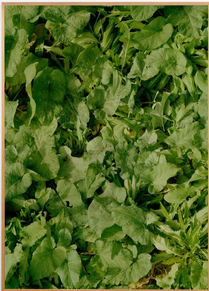
Mikkel McAlinden: Walk in the Park , 2023, C-print © Mikkel McAlinden / BONO 2024 Copyright/foto: Øystein Thorvaldsen / Galleri K